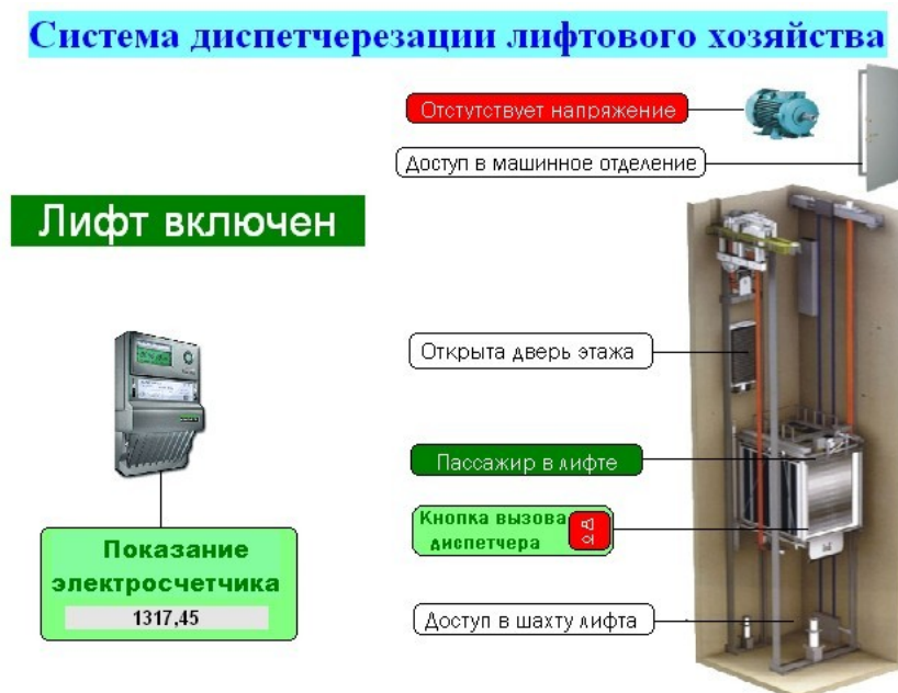
• Рисунок 2 – Индикация состояния лифта

АРМ диспетчера позволяет контролировать исправность лифтового оборудования микрорайона или всего города, в зависимости от варианта организации системы. В случае аварии при наличии человека в лифте диспетчер может связаться с пострадавшим и своевременно вызвать аварийную бригаду для его освобождения. Программное обеспечение АРМ диспетчера позволяет фиксировать и сохранять произошедшие события для формирования отчетов.