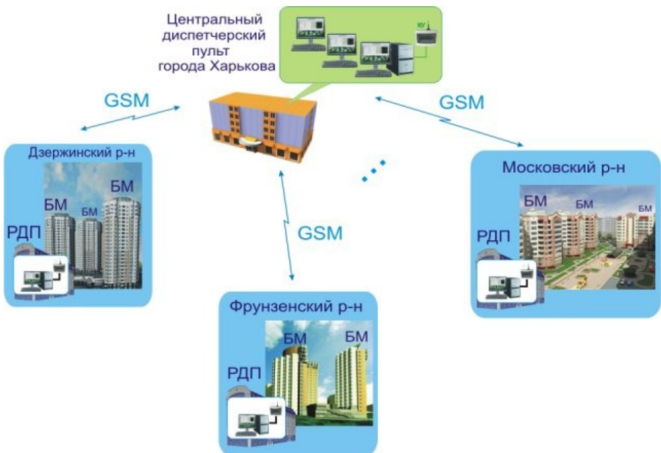
Рисунок 1 – Один из вариантов организации системы